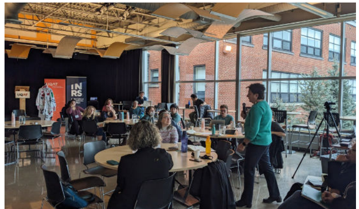
Figure 9 : Photo de la salle où on peut voir les participant.e.s à l'événement.

Elle appelle à une réévaluation fondamentale : Comment les savoirs autochtones peuvent-ils être privilégiés au sein des structures coloniales ? Linda souligne l'importance cruciale de créer des espaces dédiés aux universitaires autochtones et d'encourager les efforts de collaboration pour réformer les processus actuels et identifier les pratiques de recherche optimales.