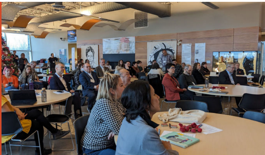
Figure 10 : Photo de la salle où on peut voir les participant.e.s à l'événement.